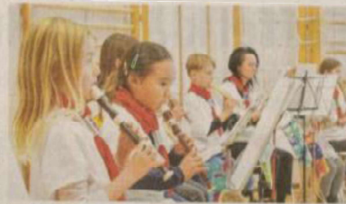
Endlich wieder zusammen musizieren.

Das Programm gut durchmischt und sehr abwechslungs-