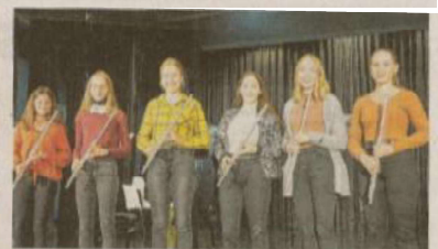
Das Querflötenensemble hatte Spaß.