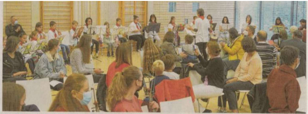
Ein klingvolles Herbstkonzert hat die Musikschule Neresheim den vielen Besuchern geboten.